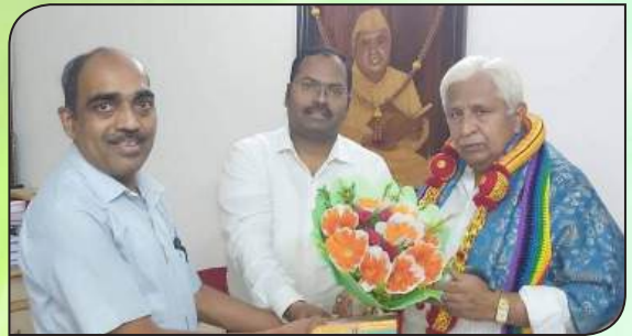
ಮಾನ್ಯ ಸಚಿವರಾದ ಶ್ರೀ ಹೆಚ್. ಕೆ ಪಾಟೀಲ ಇವರಿಗೆ ಸನ್ಮಾನ