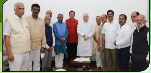
ಕೇಂದ್ರ ಸಹಕಾರ ಸಚಿವರ ಜೊತೆಯಲ್ಲಿ ಸಂಯುಕ್ತ ಸಹಕಾರಿಯ ಆಡಳಿತ ಮಂಡಳಿ ಸದಸ್ಯರು ಹಾಗೂ ಗಣ್ಯರುಗಳು