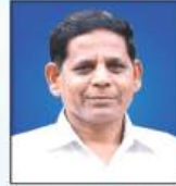
ಗುರುನಾಥ ಚೌಕರಿಕರ ನಿರ್ದೇಶಕರು