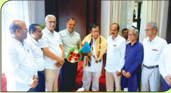
ಮಾಜಿ ಸಹಕಾರ ಸಚಿವರಾದ ಶ್ರೀ ಕೆ.ಎನ್ ರಾಜಣ್ಣನವರೊಂದಿಗೆ ಸಂಯುಕ್ತ ಸಹಕಾರಿಯ ಆಡಳಿತ ಮಂಡಳಿ ಸದಸ್ಯರು