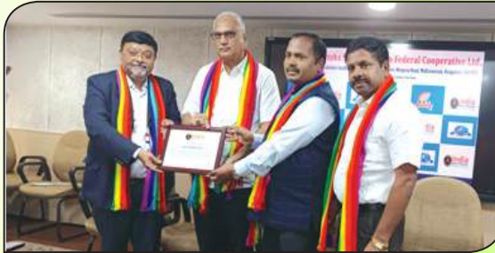
ಸೌಹಾರ್ದ ಸಹಕಾರಿ ದಿನ ದ್ವಜಾರೋಹಣ ಇಂಡಿಯಾ ಬುಕ್ ಆಫ್ ರೆಕಾರ್ಡ್‌ಗೆ ಸೇರ್ಪಡೆ