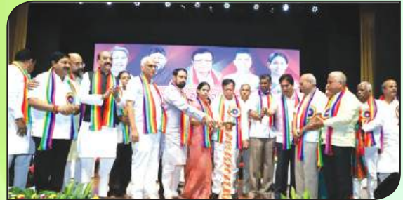
ಬೆಳಗಾವಿಯಲ್ಲಿ 71ನೇ ಅಖಿಲ ಭಾರತ ಸಹಕಾರ ಸಪ್ತಾಹ ಆಚರಣೆ