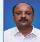
ಮಹನೇವಸ್ವಾಮಿ ವ್ಯಕ್ತಿಪರ ನಿರ್ದೇಶಕರು