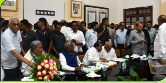
ಮಾನ್ಯ ಮುಖ್ಯಮಂತ್ರಿಗಳು ಹಾಗೂ ಸಹಕಾರ ಸಚಿವರಿಗೆ ಸನ್ಮಾನ