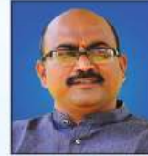
ಬಗದೀಶ ಕವಟಗಿಮಕ ನಿರ್ದೇಶಕರು