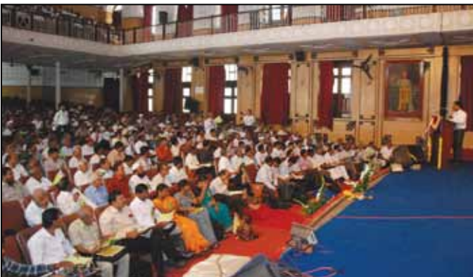
ಸಾಮಾನ್ಯ ಸಭೆಯಲ್ಲಿ ಪ್ರಶೋತ್ತರ