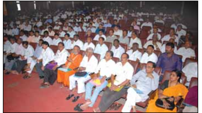
ವಿದ್ಯಾರ್ಥಿಗಳ ಪಾಲಕರು, ಸಹಕಾರಿ ಗಣ್ಯರು