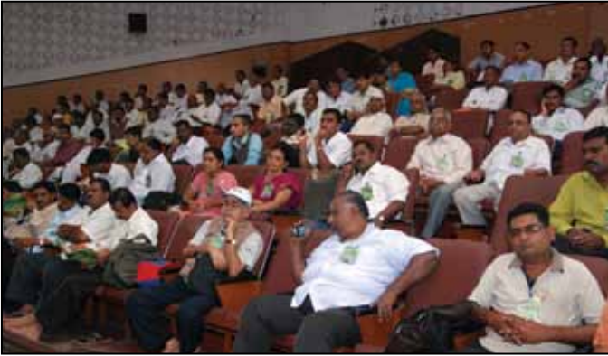
ಸಾಮಾನ್ಯ ಸಭೆಯಲ್ಲಿ ಪ್ರತಿನಿಧಿಗಳು