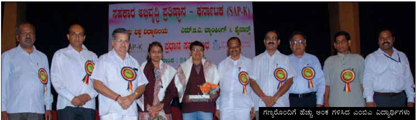
ಗಣ್ಯರೊಂದಿಗೆ ಹೆಚ್ಚು ಅಂಕ ಗಳಿಸಿದ ಎಂಬಿಎ ವಿದ್ಯಾರ್ಥಿಗಳು