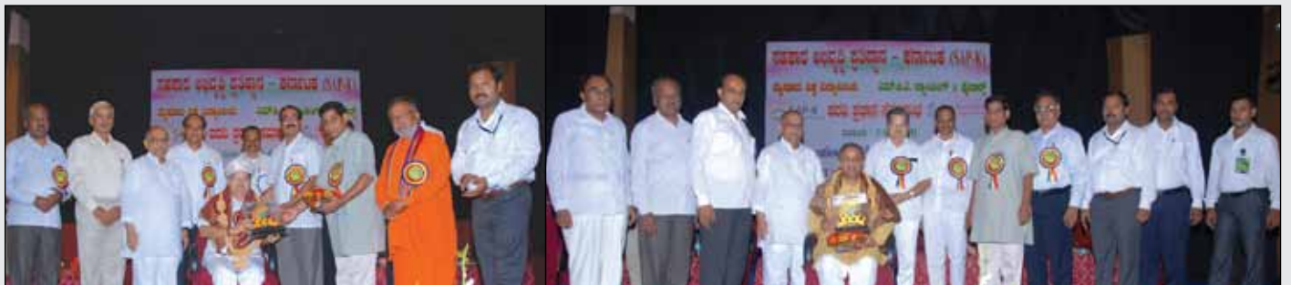
ಸನ್ಮಾನ : ಉನ್ನತ ಶಿಕ್ಷಣ ಸಚಿವರಾದ ಡಾ.ವಿ.ಎಸ್.ಆಚಾರ್ಯ ಹಾಗೂ ವಿಧಾನ ಪರಿಷತ ಸದಸ್ಯ ಶ್ರೀ ಗಣೇಶ ಕಾರ್ಣಿಕ ರವರನ್ನು ಸಂಯುಕ್ತ ಸಹಕಾರಿಯ ವತಿಯಿಂದ ಶಾಲು ಹೊದಿಸಿ ಹಾರ ಹಾಕಿ ಸ್ಮರಣಿಕೆ ನೀಡಿ ಫಲಶಾಂತಿಯಿಂದ ನೀಡಿ ಸನ್ಮಾನಿಸಲಾಯಿತು.