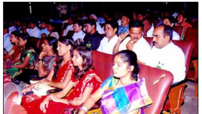
ಸಮಾರಂಭದಲ್ಲಿ ವಿದ್ಯಾರ್ಥಿಗಳು ಹಾಗೂ ಗಣ್ಯರು