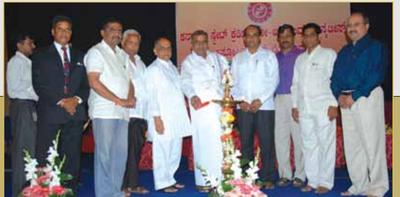
“ನೇರ ತೆರಿಗೆ ಪದ್ಧತಿ” ಕುರಿತಾದ ಕಾರ್ಯಕ್ರಮವನ್ನು ಸಹಕಾರಿ ಮಹಾ ಮಂಡಳದ ಅಧ್ಯಕ್ಷರೂ, ಮಾಜಿ ಸಹಕಾರ ಸಚಿವ ಶ್ರೀ ಜಿ.ಟಿ.ದೇವೇಗೌಡರವರು ಉದ್ಘಾಟಿಸಿದರು.