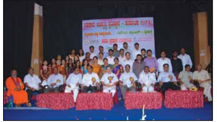
ಸಹಕಾರಿ ಅಭಿವೃದ್ಧಿ ಪ್ರತಿಷ್ಠಾನ ಸಭೆಯಲ್ಲಿ ಗಣ್ಯರೊಂದಿಗೆ ವಿದ್ಯಾರ್ಥಿಗಳು

ತಿಕ ಆರ್ಥಿಕ ಹಿಂಜರಿತದಂತಹ ಹಾಗೂ ಆರ್.ಬಿ.ಎ ನಿಂದ ಪತ್ತಿನ ಸಹಕಾರಿ ಸಂಸ್ಥೆಗಳಿಗೆ ಎದುರಿಸಿ ಕಾರ್ಯನಿರ್ವಹಿಸುವ ಕಾರ್ಯಕ್ರಮತೆಯನ್ನು ಹೆಚ್ಚಿಸಿಕೊಳ್ಳುವ ಅಗತ್ಯ ಇದೆ ಎಂದು