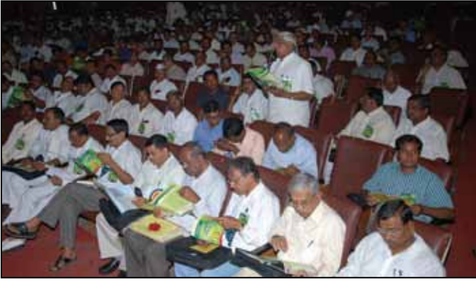
ಸಾಮಾನ್ಯ ಸಭೆಯಲ್ಲಿ ಪ್ರತಿನಿಧಿಗಳು