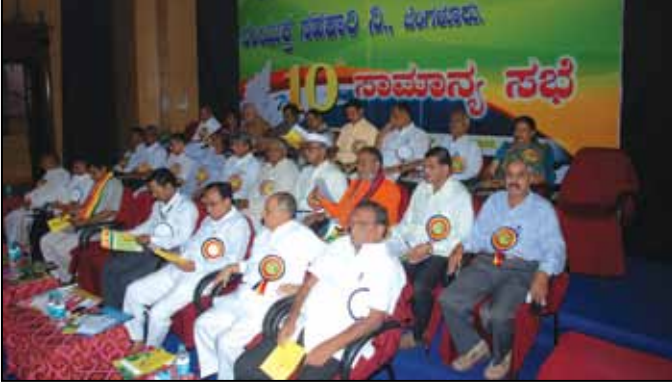
ಆಡಳಿತ ಮಂಡಳಿ ಸದಸ್ಯರು