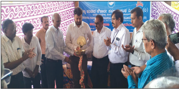
ಕಲಬುರಗಿ : ದಿನಾಂಕ 10.06.2022 ರಂದು ಕೃಷ್ಣಾ ಪರಿವಾರ ಸೌಹಾರ್ದ ಸಹಕಾರಿ ಸಂಘ ನಿ., ಕಲಬುರಗಿ ಇದರ ಉದ್ಘಾಟನೆಯನ್ನು