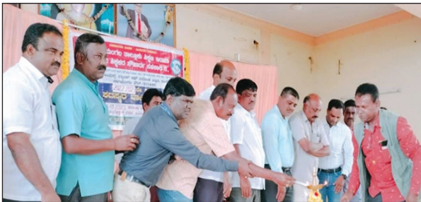
ಮಂಡ್ಯ : ದಿನಾಂಕ 16.09.2023ರಂದು ನಡೆದ ನಾಗಮಂಗಲ ತಾಲ್ಲೂಕು ಶಿಕ್ಷಣ ಇಲಾಖೆ ಪದವಿ ಶಿಕ್ಷಕರ ಸೌಹಾರ್ದ ಸಹಕಾರಿ ಸಂಘ ನಿ., ನಾಗಮಂಗಲ ಇದರ 2022-23ನೇ ಸಾಲಿನ ಸರ್ವ ಸದಸ್ಯರ ವಾರ್ಷಿಕ

ಸಹಕಾರಿಯು 2022-23 ನೇ ಸಾಲಿನಲ್ಲಿ ರೂ 38.34 ಕೋಟಿ