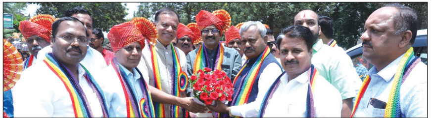
ಮಾನ್ಯ ಸಹಕಾರ ಸಚಿವರ ಆಗಮನ