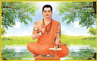
ಮೇ 3, ಬಸವ ಜಯಂತಿ