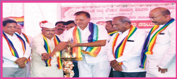
ಕಲಬುರಗಿ ಪ್ರಾಂತೀಯ ಕಟ್ಟಡದ ಉದ್ಘಾಟನೆ