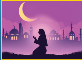
ಮೇ 3, ರಂಜಾನ್