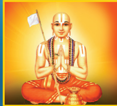
ಮೇ 5, ರಾಮಾನುಜಾಚಾರ್ಯ ಜಯಂತಿ