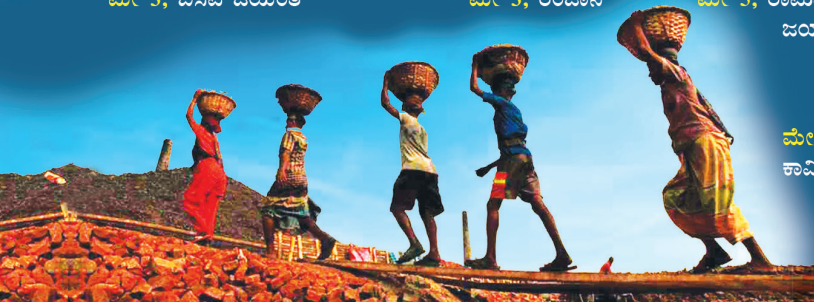
ಮೇ 1, ಕಾರ್ಮಿಕರ ದಿನಾಚರಣೆ