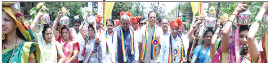
ಮಾನ್ಯ ಸಹಕಾರ ಸಚಿವರಿಗೆ ಪೂರ್ಣ ಕುಂಬ ಸ್ವಾಗತ