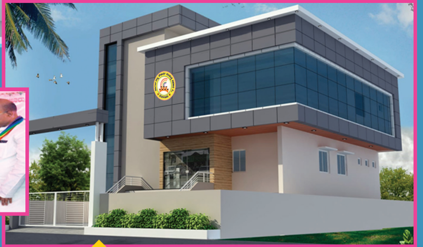
ಕಲಬುರಗಿ ಪ್ರಾಂತೀಯ ಕಟ್ಟಡ