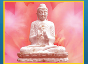
ಮೇ 16, ಬುದ್ಧ ಪೂರ್ಣಿಮೆ