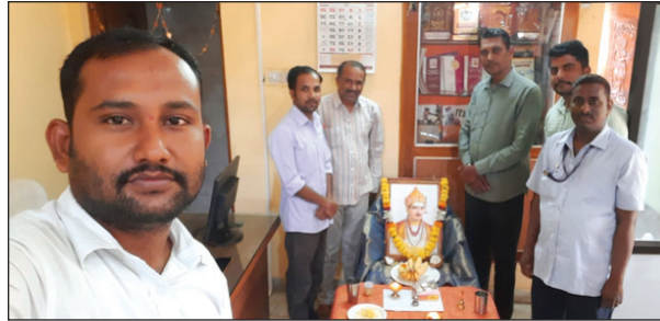
ಕಲಬುರಗಿ ಪ್ರಾಂತೀಯ ಕಛೇರಿ