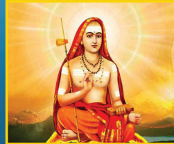
ಮೇ 6, ಶಂಕರಾಚಾರ್ಯ ಜಯಂತಿ