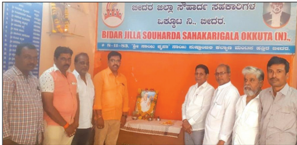
ಬೀದರ ಜಿಲ್ಲಾ ಸಂಪರ್ಕದಲ್ಲಿ ಕಛೇರಿಯಲ್ಲಿ ಬಸವ ಜಯಂತಿ ಆಚರಣೆ.