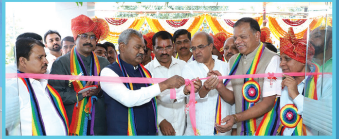
ಬೆಳಗಾವಿ ಪ್ರಾಂತೀಯ ಕಟ್ಟಡ ಉದ್ಘಾಟನೆ