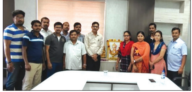
ಬೆಳಗಾವಿ ಪ್ರಾಂತೀಯ ಕಛೇರಿ