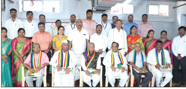
ಸಂಯುಕ್ತ ಸಹಕಾರಿಯ ಮಾನ್ಯ ಹಾಲ ಮತ್ತು ಮಾಜಿ ನಿರ್ದೇಶಕರಿಗೆ ಹಾಗೂ ಹಿರಿಯ ಸಹಕಾರಿಗಳಿಗೆ ಸನ್ಮಾನ