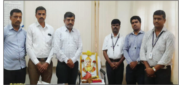
ಮೈಸೂರು ಪ್ರಾಂತೀಯ ಕಛೇರಿ