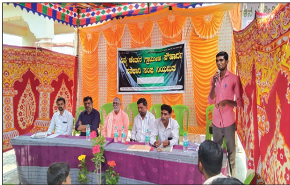
ಮೈಸೂರು : ದಿವ್ಯಚೇತನ ಗ್ರಾಮೀಣ ಸೌಹಾರ್ದ ಸಹಕಾರಿ ಸಂಘ ನಿ.,

ಇದರ ಉದ್ಘಾಟನಾ ಕಾರ್ಯಕ್ರಮವನ್ನು ದಿನಾಂಕ 01-05-2022ರಂದು ಭಾನುವಾರ ಮಧ್ಯಾಹ್ನ 12.00 ಗಂಟೆಗೆ ಕೂಡನಹಳ್ಳಿ ಗ್ರಾಮ, ಬಸ್ ನಿಲ್ದಾಣದ ಹತ್ತಿರ, ವರುಣಾ ಹೋಬಳಿ, ಮೈಸೂರು ಇಲ್ಲಿ ಆಯೋಜಿಸಲಾಗಿತ್ತು.