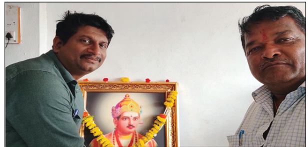
ಶ್ರೀ ಬಸವೇಶ್ವರ ವಿವಿಧ ಉದ್ದೇಶಗಳ ಸೌಹಾರ್ದ ಸಹಕಾ- ಲಿಯಲ್ಲಿ ಬಸವ ಜಯಂತಿ ಆಚರಣೆ.