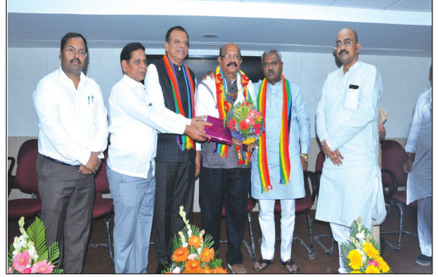
ಕಲಬುರಗಿ ಸಂಸದರಾದ ಶ್ರೀ ಉಮೇಶ್ ಜಾಧವ್ ಇವರಿಗೆ ಸನ್ಮಾನ