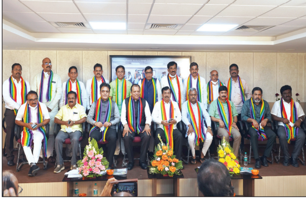
ಸಜಿವರು ಹಾಗೂ ವಿಧಾನ ಪರಿಷತ್ ಸದಸ್ಯರು