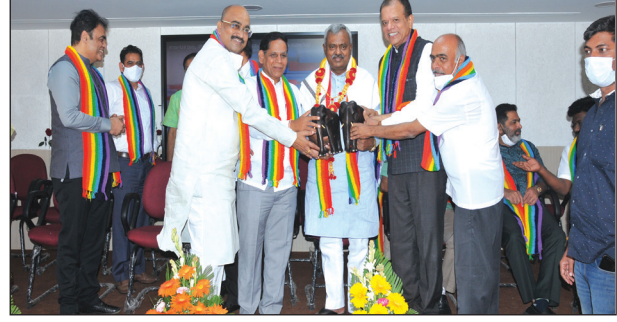
ಸಹಕಾರ ಸಚಿವರಾದ ಸನ್ಮಾನ್ಯ ಶ್ರೀ ಎಸ್ ಟಿ ಸೋಮಶೇಖರ್‌ವರಿಗೆ ಸನ್ಮಾನ