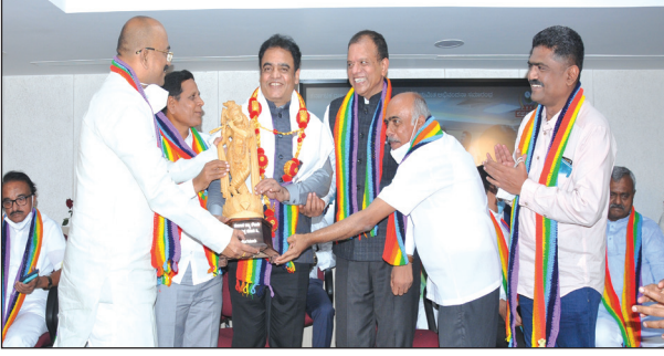
ಉನ್ನತ ಶಿಕ್ಷಣ ಸಚಿವರಾದ ಸನ್ಮಾನ್ಯ ಡಾ. ಸಿ ಎನ್ ಅಶ್ವತ್ಥನಾರಾಯಣ್ ಇವರಿಗೆ ಸನ್ಮಾನ

ಇಲಾಖಾ ಅಧಿಕಾರಿಗಳ, ನಿವೃತ್ತ ಅಧಿಕಾರಿಗಳ, ಹಿರಿಯ ಸಹಕಾರಿಗಳೊಂದು ಸಭೆಯನ್ನು ಜರುಗಿಸಿ ಸಹಕಾರ ಕ್ಷೇತ್ರದ ಬಗ್ಗೆ ವಿಶ್ವಾಸಾರ್ಹತೆ ಹೆಚ್ಚಿಸುವುದಕ್ಕೆ ಅಗತ್ಯ ತಿದ್ದುಪಡಿಗಳನ್ನು ಮುಂಬರುವ ಅಧಿವೇಶನದಲ್ಲಿ ಮಂಡಿಸಲು ಕ್ರಮವಿಡಲಾಗುವುದು.